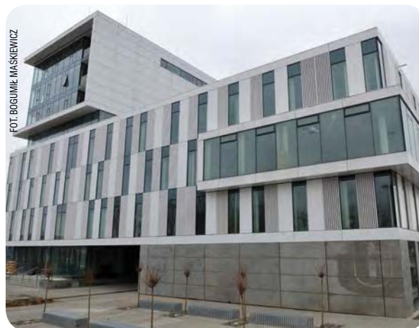
Budynki neofilologii i administracji centralnej

powstało tam nowoczesne Centrum Dydaktyczno-Konferencyjne Wydziału Zarządzania, a w październiku 2010 roku – Centrum Komputerowe, będące przy okazji łącznikiem pomiędzy dotychczasowym budynkiem głównym Wydziału a aulą wykładową. Projekt otrzymał dofinansowanie z Europejskiego Funduszu Rozwoju Regionalnego w ramach Regionalnego Programu Operacyjnego dla Województwa Pomorskiego na lata 2007–2013. Także Wydział Ekonomiczny wzbogacił się o piękny nowy budynek o powierzchni 5550 m 2 , który w funkcjonalny sposób wykorzystuje przestrzeń między skrzydłami dotychczasowej siedziby Wydziału i tworzy z nim integralną całość. W ramach Sopockiego Kampusu UG w planach jest także rozbudowa i modernizacja Domu Studenckiego nr 9.