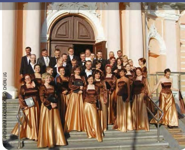
Akademicki Chór Uniwersytetu Gdańskiego