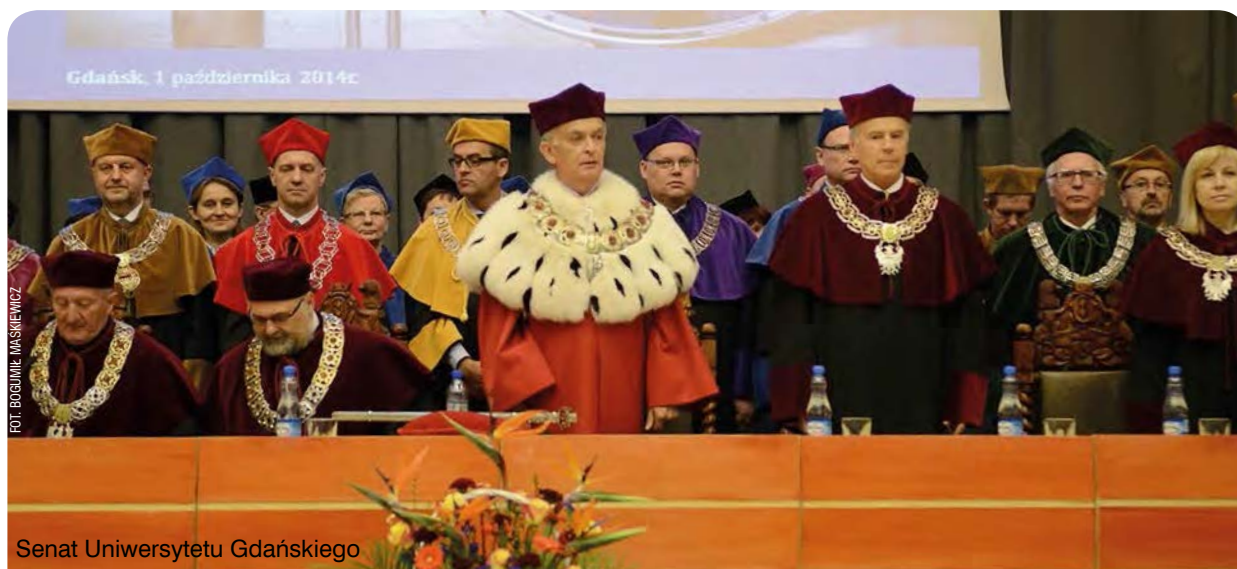
Senat Uniwersytetu Gdańskiego