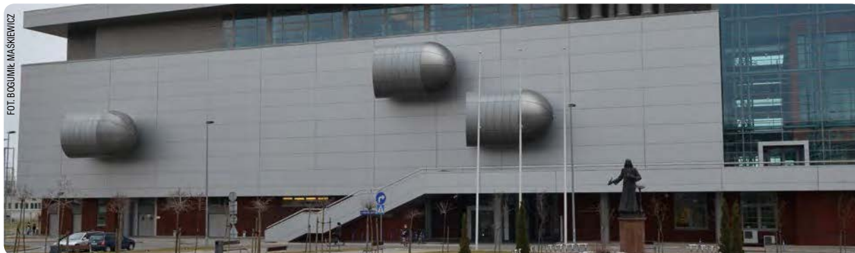
Biblioteka Główna UG

W Sopocie, zgodnie z wieloletnią tradycją, swoje miejsce mają nauki ekonomiczne. Mieszczą się tam Wydział Ekonomiczny i Zarządzania. W 2006 roku