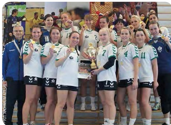
Piłkarki ręczne Uniwersytetu Gdańskiego podczas finału Akademickich Mistrzostw Polski w 2013 roku