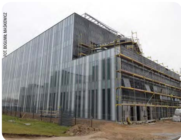
Nowy budynek Instytutu Biotechnologii

powstało tam nowoczesne Centrum Dydaktyczno-Konferencyjne Wydziału Zarządzania, a w październiku 2010 roku – Centrum Komputerowe, będące przy okazji łącznikiem pomiędzy dotychczasowym budynkiem głównym Wydziału a aulą wykładową. Projekt otrzymał dofinansowanie z Europejskiego Funduszu Rozwoju Regionalnego w ramach Regionalnego Programu Operacyjnego dla Województwa Pomorskiego na lata 2007–2013. Także Wydział Ekonomiczny wzbogacił się o piękny nowy budynek o powierzchni 5550 m 2 , który w funkcjonalny sposób wykorzystuje przestrzeń między skrzydłami dotychczasowej siedziby Wydziału i tworzy z nim integralną całość. W ramach Sopockiego Kampusu UG w planach jest także rozbudowa i modernizacja Domu Studenckiego nr 9.