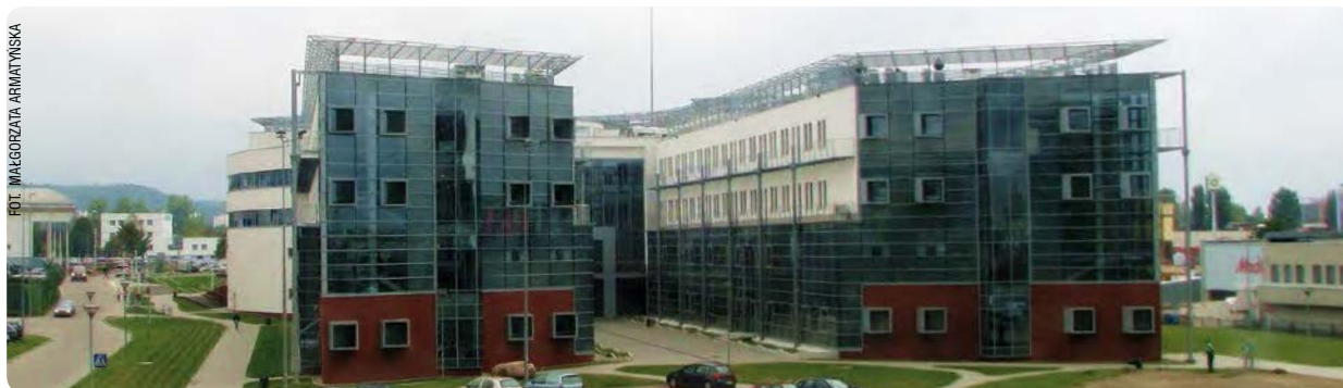
Wydział Nauk Społecznych i Instytut Geografii